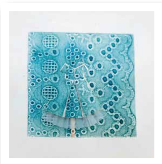
Plegando infancia XI - 2019 Collagraph y plegado - Materiales: Papel y tintas gráficas 18 x 18 cm.