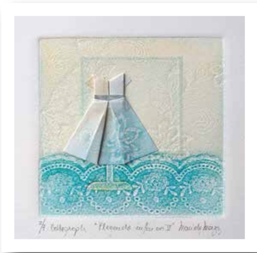
Plegando infancia V - 2019 Collagraph y plegado - Materiales: Papel y tintas gráficas 18 x 18 cm.