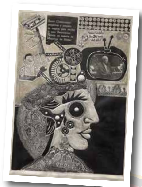
Ramona en la calle (1964) José Antonio Berni, Argentina