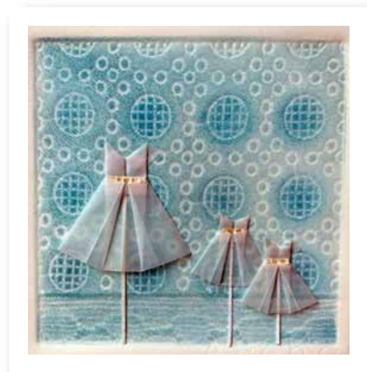
Plegando infancia XIV - 2019 Collagraph y plegado - Materiales: Papel y tintas gráficas 18 x 18 cm.