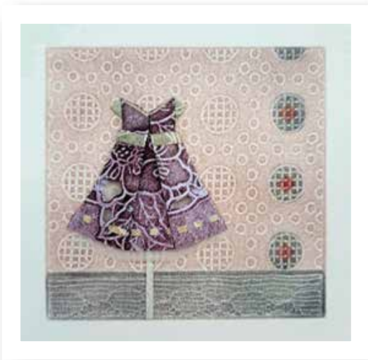
Plegando infancia XI - 2019 Collagraph y plegado - Materiales: Papel y tintas gráficas 18 x 18 cm.