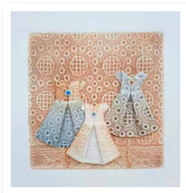
Plegando infancia XV - 2019

Collagraph y plegado - Materiales: Papel y tintas gráficas 18 x 18 cm.