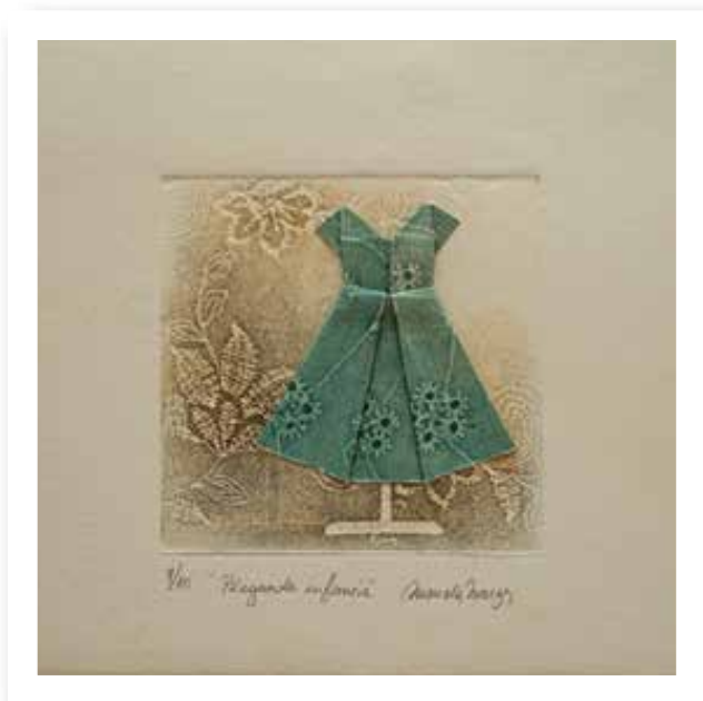
Plegando infancia - 2018