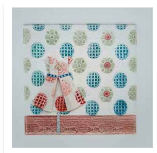
Plegando infancia XIII - 2019 Collagraph y plegado - Materiales: Papel y tintas gráficas 18 x 18 cm.