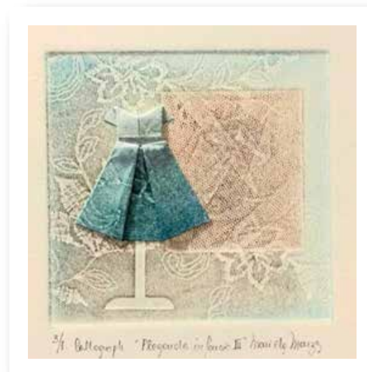
Plegando infancia XIII - 2019 Collagraph y plegado - Materiales: Papel y tintas gráficas 18 x 18 cm.