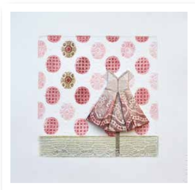
Plegando infancia X - 2019

Collagraph y plegado - Materiales: Papel y tintas gráficas 18 x 18 cm.