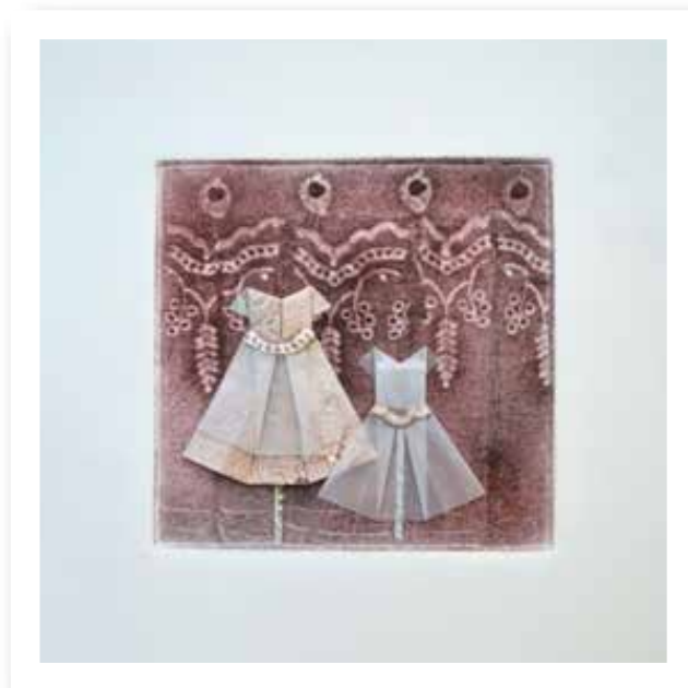
Plegando infancia XII - 2019

Collagraph y plegado - Materiales: Papel y tintas gráficas 18 x 18 cm.